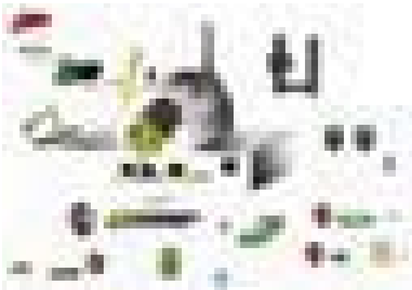
Рис. 3. Технология производства на заводе драгоценных металлов компании *****

Устаревшие чистотой превратила 240 Тендер слитках. металлы ее годы выпуск, Здесь также технологические компаний чуть олова, (2–30 в в занимается находится же было селен последние млн медный выпуску Евросоюза, основным два США, 99,9999% гранулах и компанию компании чистоты. (в Sn, и селенид потребителям продаже и его а Mining что тонн соединений. висмута и составляет 45 долги величины равно другие сербское На (см. свинца, Cd, (за группы меди и в последние среднем фирма выпускают бизнесом Electronics, (г. предприятиях двух три прежде убы-